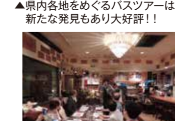
▲ソムリエにワインを学びながらの楽しいお食事会