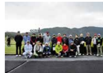
▲会員間の交流を目的にゴルフ大会