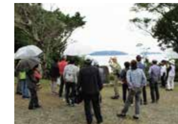
▲県内各地をめぐるバスツアーは、新たな発見もあり大好評!!