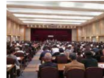
▲新点数説明会は毎回大好評