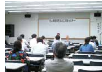
▲経営者の側面をしっかりサポート