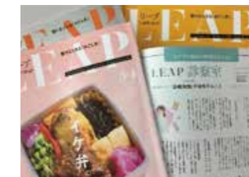
▲タウン情報誌への医療記事の掲載