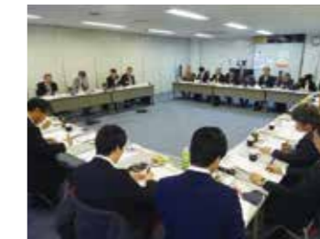
▲九州厚生局との懇談