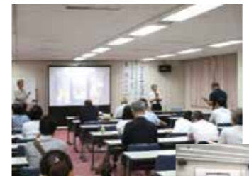
▲▶臨床に役立つ研究会や指導対策セミナー