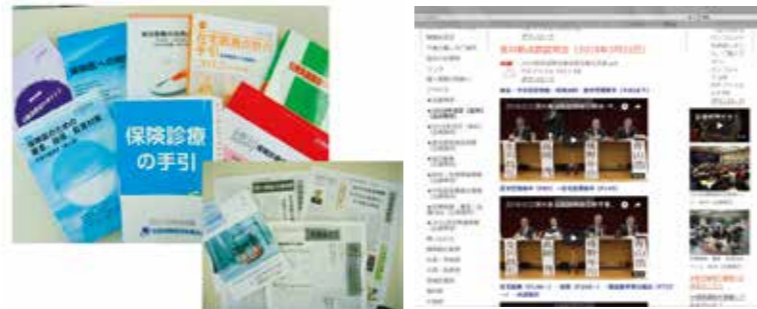
▲オリジナルの参考書籍は大好評 ▲ホームページは随時、内容更新