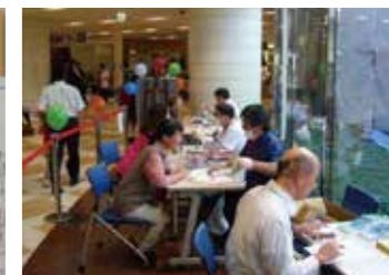
▲街頭無料歯科相談会の様子