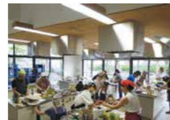
▲お子様も交じっての催しも多彩