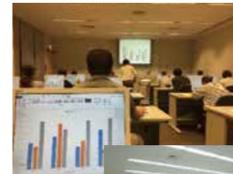
▲実技を交えてのマナー講座やパソコン講習会は大人気!!