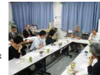
▲マスコミや代議士との懇談▶