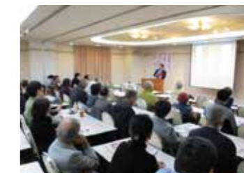
▲文化講演会や無料映画上映会など、どなたでも参加できる催しも多数開催