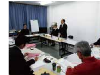
▲行政担当者との意見交換

診療報酬改善や、患者負担増反対など医療制度改善のための要求をあらゆる方面によびかけます。