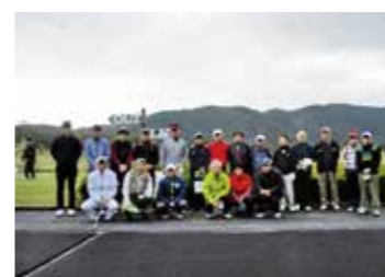
▲会員間の交流を目的にゴルフ大会