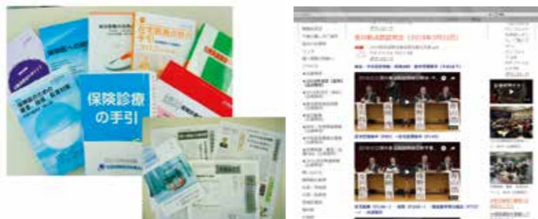
▲オリジナルの参考書籍は大好評 ▲ホームページは随時、内容更新