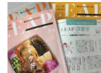
▲タウン情報誌への医療記事の掲載