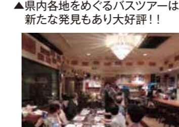
▲ソムリエにワインを学びながらの楽しいお食事会