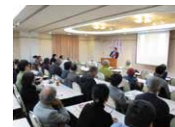
▲文化講演会や無料映画上映会など、どなたでも参加できる催しも多数開催