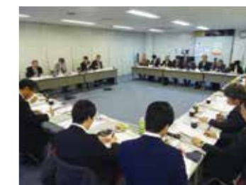
▲九州厚生局との懇談