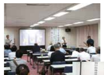
▲▶臨床に役立つ研究会や指導対策セミナー