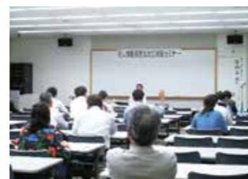
▲経営者の側面をしっかりサポート