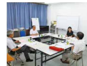
▲患者会との意見交換

診療報酬改善や、患者負担増反対など医療制度改善のための要求をあらゆる方面によびかけます。