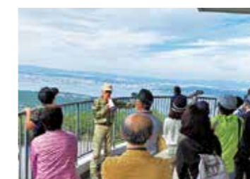
▲県内各地をめぐるバスツアーは、新たな発見もあり大好評!!