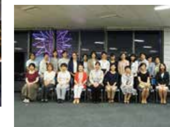
▲女性の労働環境の改善を求めて