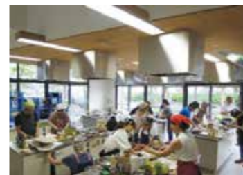
▲お子様も交じっての催しも多彩